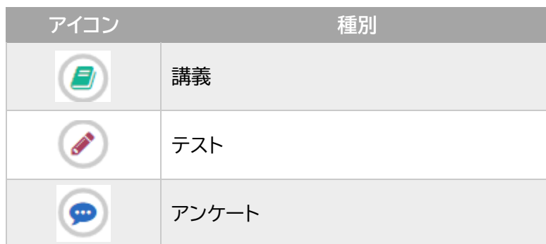
表- 7 e-ラーニングの種別アイコン一覧